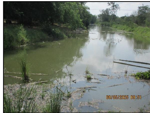
ภาพที่ 2.8 คลองห้วยแร่