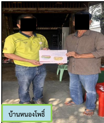
บ้านหนองโพธิ์

รายงานผลการปฏิบัติตามมาตรการป้องกันและแก้ไขผลกระทบสิ่งแวดล้อมและมาตรการติดตามตรวจสอบผลกระทบสิ่งแวดล้อม โครงการเหมืองแร่ดินอุตสาหกรรมชนิดดินซีเมนต์ คำขอประทานบัตรที่ 2/2551, 3/2551 และ 4/2551 ของบริษัทปูนซีเมนต์ไทย (ท่าหลวง) จำกัด ระหว่างเดือนมกราคม-มิถุนายน 2568