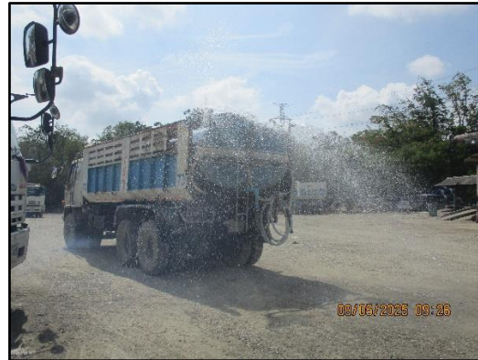
ภาพที่ 2.21 รถบรรทุกน้ำคอยฉีดพรมถนนภายในพื้นที่โครงการ