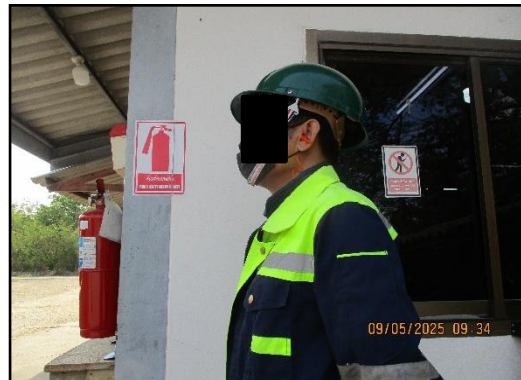
ภาพที่ 2.25 พนักงานสวมใส่อุปกรณ์ป้องกันอันตราย