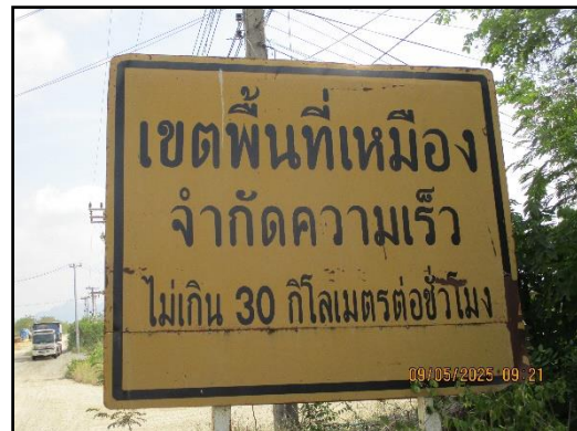
ภาพที่ 2.12 ป้ายจำกัดความเร็วไม่เกิน 30 กิโลเมตร/ชั่วโมง