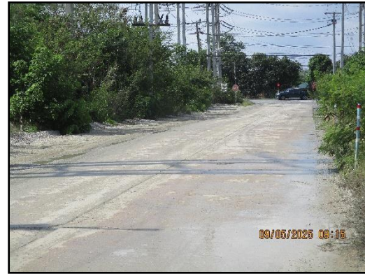
ภาพที่ 2.6 สภาพเส้นทางขนส่งแร่ (ส่วนบุคคล) ช่วงก่อนเข้าสู่ท่าหลวง