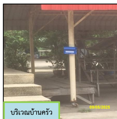
ภาพที่ 2.1 กล่องรับเรื่องราวร้องทุกข์