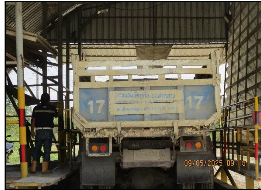
ภาพที่ 2.24 ด้านซังน้ำหนักรถบรรทุกขนส่งแร่