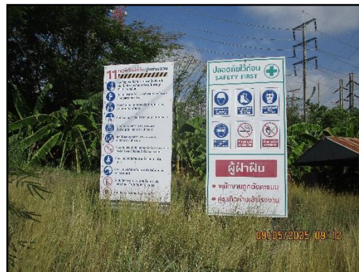
ภาพที่ 2.14 นโยบายความปลอดภัยอาชีวอนามัย และสิ่งแวดล้อมในการทำงาน