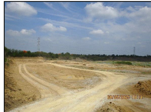
ภาพที่ 2.3 การเว้นระยะห่างจากแนวสายไฟ