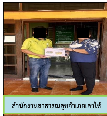
สำนักงานสาธารณสุขอำเภอเส้าไห้