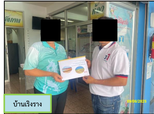
ภาพที่ 2.2 (ต่อ) ป้ายประชาสัมพันธ์ผลการตรวจวัดคุณภาพสิ่งแวดล้อมภายในชุมชนบริเวณโครงการ