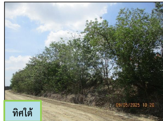
ภาพที่ 2.4 คันทำนบดินของพื้นที่โครงการ