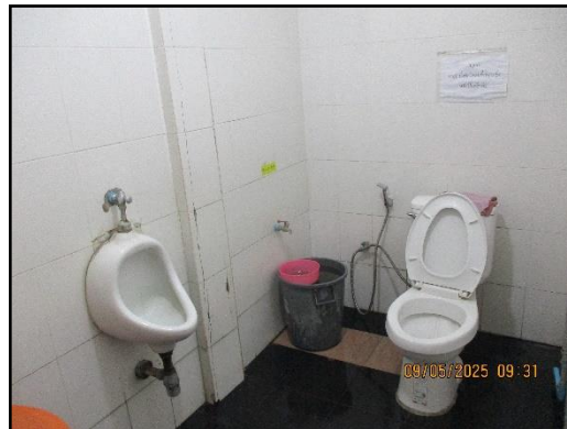
ภาพที่ 2.18 สุขาภายในพื้นที่โครงการ