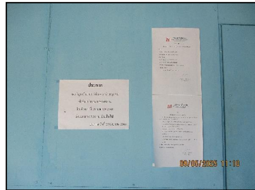
ภาพที่ 2.10 บอร์ดประชาสัมพันธ์ความรู้ต่างๆ ภายในพื้นที่โครงการ