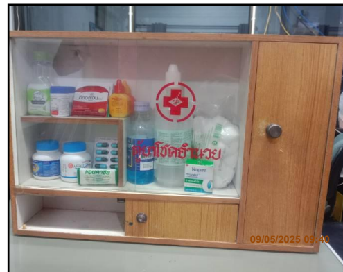
ภาพที่ 2.16 ตู้ปฐมพยาบาลเบื้องต้น ประจำโครงการ