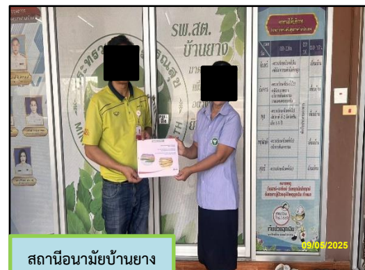
สถานีอนามัยบ้านยาง