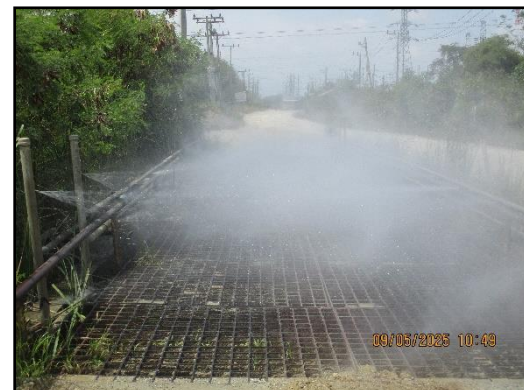
ภาพที่ 2.5 บ่อล้างล้อรถบรรทุกในช่วงถนนคอนกรีตของเส้นทางขนส่งแร่