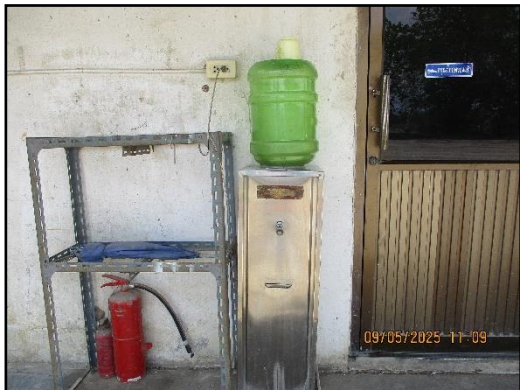
ภาพที่ 2.17 ตู้บริการน้ำดื่มภายในพื้นที่โครงการ