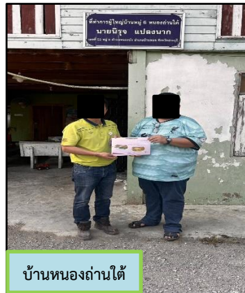
บ้านหนองถ่านใต้