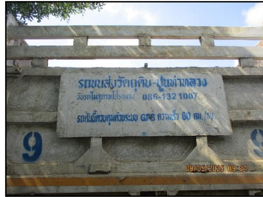
ภาพที่ 2.13 รถบรรทุกแร่ที่มีการติดชื่อโครงการ และหมายเลขโทรศัพท์