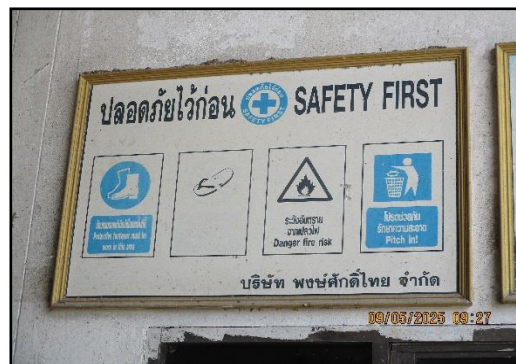
ภาพที่ 2.26 ป้ายเตือนบริเวณที่มีความเสี่ยงและกำหนดให้สวมใส่อุปกรณ์ป้องกันอันตรายส่วนบุคคล