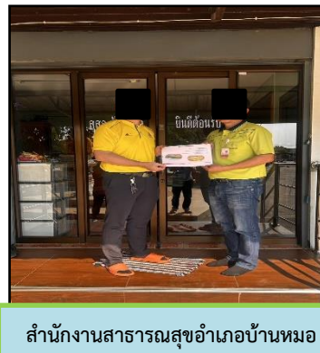
สำนักงานสาธารณสุขอำเภอบ้านหมอ