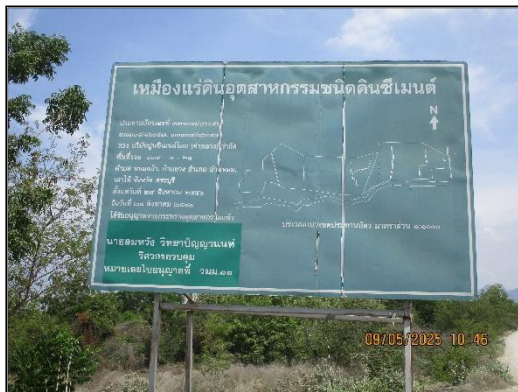
ภาพที่ 2.15 ป้ายประทานบัตร