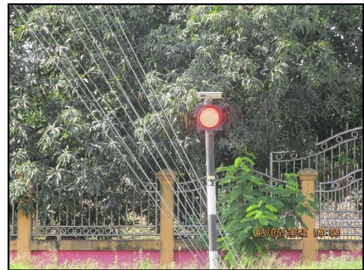
ภาพที่ 2.11 ป้ายจราจร และสัญญาณไฟให้ชะลอความเร็วบริเวณช่วงก่อนเลี้ยวเข้า-ออก พื้นที่โครงการ