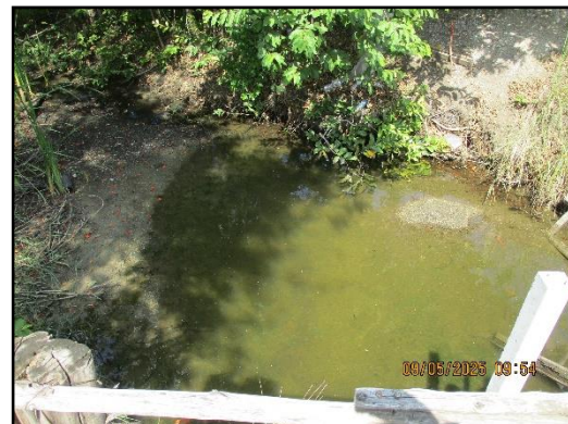
ภาพที่ 2.9 คูระบายน้ำด้านนอกคันทำนบ