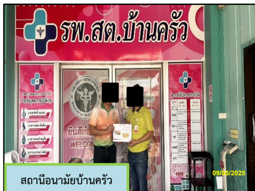
สถานีอนามัยบ้านครัว