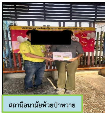
สถานีอนามัยห้วยป่าหวาย