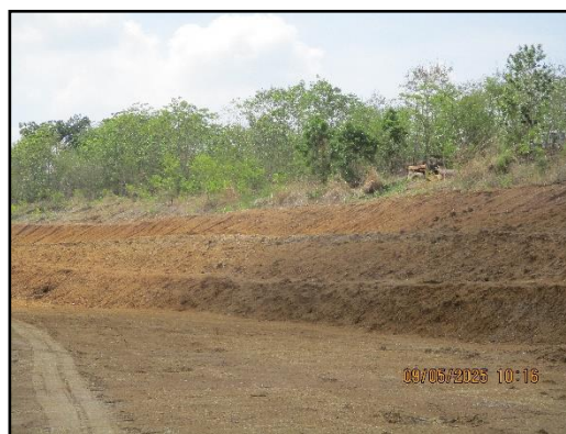
ภาพที่ 2.19 การเปิดหน้าเหมืองในลักษณะชั้นบันได