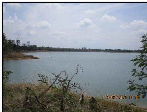
ภาพที่ 2.20 จุดรับน้ำเพื่อนำมาฉีดพรมถนนลำเลียงแร่