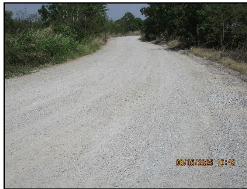
ภาพที่ 2.7 ถนนลาดยางที่เพิ่มไปยังขอบบ่อเหมือนเก่าของโครงการ