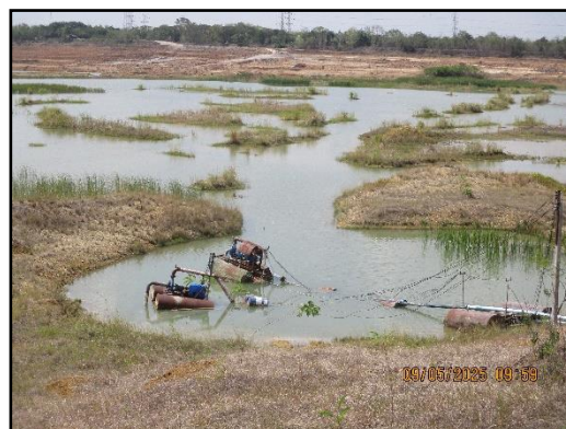
ภาพที่ 2.23 บ่อรวบรวมน้ำ (Sump)